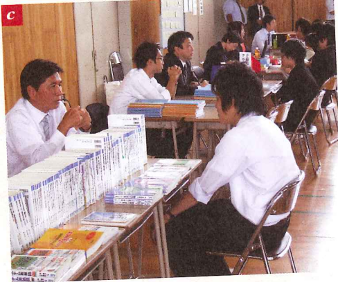
写真 a (右ページ) 統一学校説明会には全校生徒が参加する / b 受験に関する講演も行われる / c 予備校も参加。受験のプロとして、詳細なデータに基づいた進学指導をしてくれる / d 通常は有料の願書を無料配布する学校も