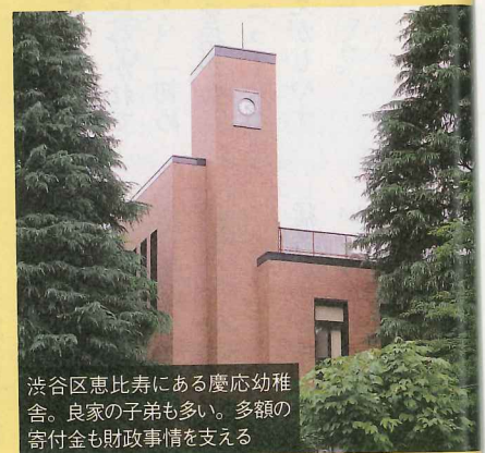
渋谷区恵比寿にある慶応幼稚舎。良家の子弟も多い。多額の寄付金も財政事情を支える